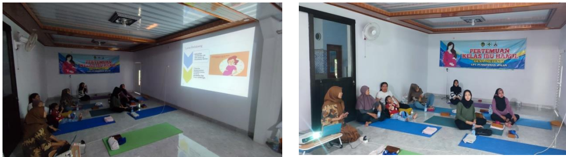
Gambar 2. Pemberian Edukasi tentang Prenatal Yoga

Setelah dilakukan pemeriksaan, tim pengabdian memberikan edukasi/ penyuluhan kesehatan tentang prenatal yoga untuk menambah pengetahuan dan pemahaman ibu akan pentingnya prenatal yoga dalam mengatasi keluhan/ ketidaknyamanan kehamilan terutama pada trimester III. Hasil setelah diberikan edukasi ini, tingkat pemahaman ibu meningkat, dapat dilihat dari antusiasme ibu dalam mengikuti penyuluhan dan keaktifan bertanya seputar keluhan yang dirasakan selama hamil.