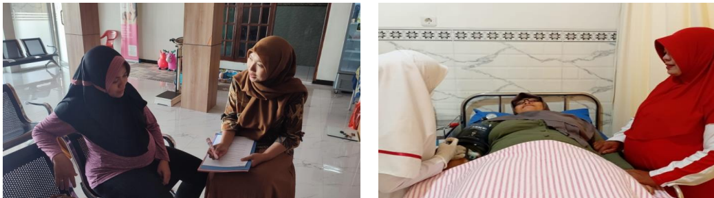
Gambar 1. Pemeriksaan Sebelum Edukasi

Sebelum dilakukan edukasi, ibu hamil diperiksa kondisi kehamilannya terlebih dahulu untuk mengetahui kondisi kesehatan ibu hamil. Setelah pemeriksaan dilakukan pemberian edukasi tentang prenatal yoga. Kegiatan pengabdian kepada masyarakat ini dapat menambah pengetahuan ibu hamil tentang prenatal yoga. Jumlah peserta 10 (sepuluh) orang yang dibagi dalam 2 sesi.