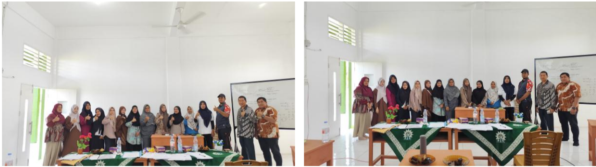
Gambar 2. Dokumentasi Kegiatan Pelatihan Kepada Masyarakat dengan Tema Pembuatan Aplikasi Pencatatan Keuangan UMKM Berbasis Excel Bagi Mustahik LAZISMU