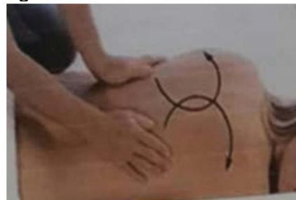
Gerakan Melingkar Lebar Seperti Kupu-kupu