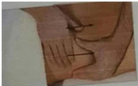
Usapan Ringan Bagian Lumbal

Pola gerakan effleurage umumnya dilakukan secara berulang pada bagian tubuh yang sama untuk memperoleh efek optimal. Pelaksanaan pijat effleurage dapat dilakukan sendiri oleh ibu hamil, dibantu oleh suami, maupun oleh bidan. Efektivitas pijatan sangat dipengaruhi oleh konsistensi pengulangan, ritme gerakan yang lambat dan stabil, tekanan yang terasa nyaman, serta keyakinan dan kepercayaan diri dari pihak yang melakukan pijatan (Neetu et al. , 2015). Materi penyuluhan disampaikan dengan sederhana sehingga peserta penyuluhan dapat dengan mudah memahaminya. Petugas membuka sesi tanya jawab dan memberikan follow up , selanjutnya petugas melakukan demonstrasi pijat effleurage yang diikuti oleh semua peserta. Setelah itu dilakukan evaluasi dari kegiatan ini.