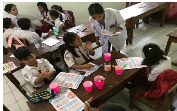
Gambar 2. Kegiatan Pengabdian Kepada Masyarakat